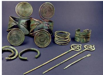
Spektakuläre Funde aus dem Hügelgrab 34, die im Heimatmuseum in der Durlacher Straße 30 in Weingarten präsentiert werden.