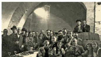
Weinprobe im Grundschulkeller 1937.

Herr Geggus wird Ihnen die teils aufwendige Gestaltung der Grabsteine und die jüdischen Bestattungsriten erklären. Sie erfahren auch, wo die jüdischen Bürger in Weingarten gewohnt haben. Hinweise darüber geben die so genannten „Stolpersteine“, eingelassen im Boden vor ihren Häusern. Zum Betreten des Friedhofs müssen Männer einen Hut aufsetzen. Sonntag, 12.06.2022, 14:00 bis ca. 16:00 Uhr. Treffpunkt: Wegkreuz am Eingang zum Effenstiel.